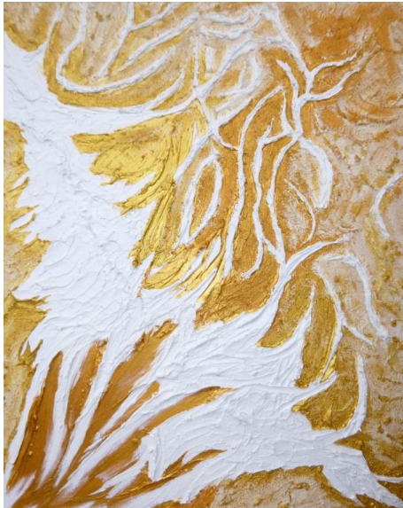
Titel: Flirrender Wüstensand Maße: Breite 40cm x Höhe 50cm Acrylfarben gemischt mit Wüstensand auf Leinwand