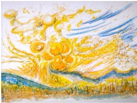
Stormy weather Wachsmalkreide auf Papier 50 x 70 cm, Foto: © Martina Koch