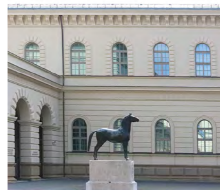
in der Schönfeldstraße, München